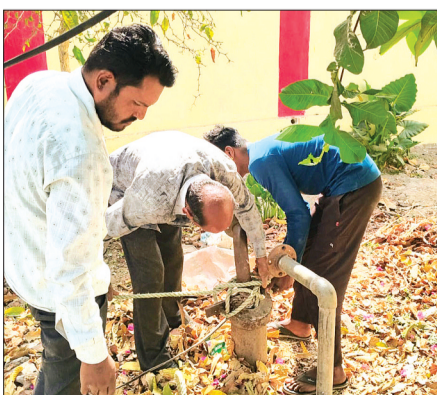
सुलभ पेयजल उपलब्ध हो सकेगा। उल्लेखनीय है कि

जल गंगा संवर्धन अभियान के अंतर्गत जिले में जल संरक्षण एवं संवर्धन से संबंधित खेत, तालाब, अमृत सरोवर, परकोलेशन टैंक, डगवेल, तालाब जीर्णोद्धार, जनभागीदारी के कार्य, कूप एवं बाउंड्री मरम्मत के कार्य से मौजूद जल संग्रहण संरचनाओं की साफ सफाई एवं जीर्णोद्धार का कार्य किया जा रहा है। अभियान के तहत जल संरक्षण जागरूकता के लिए अनेक कार्यक्रमों का आयोजन किया जा रहा है।