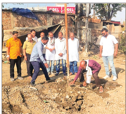
बोर को चालू किया गया, जिससे वहां के नागरिकों को

शासन के निर्देशानुसार प्रदेश के साथ ही सीहोर जिले में 19 मार्च से 30 जून तक जल गंगा संवर्धन अभियान चलाया जा रहा है। अभियान के तहत जनभागीदारी के माध्यम से कुओं, तालाओं, नदियों एवं अन्य जल स्रोतों की साफ सफाई एवं गहरीकरण का कार्य किया जा रहा है। इसके साथ ही आमजन को जल संरक्षण के प्रति जागरूक भी किया जा रहा है। अभियान के तहत जल स्रोतों के जीर्णोद्धार के लिए जनप्रतिनिधि, अधिकारी एवं नागरिक मिलकर श्रमदान कर रहे हैं, ताकि जल स्रोतों का संरक्षण हो सके। इसी क्रम जल संरक्षण गतिविधियों के अंतर्गत 20 मार्च को बुधनी के वार्ड क्रमांक 07 में पुराने बोरवेल की सफाई की गई और मोटर पंप डालकर